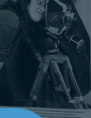
Chantal Akerman aan de slag met haar camera.

De laatste jaren van Chantal Akerman Chantal Akerman's laatste jaren waren een tijd van ontdekking en groei. Ze heeft haar eigen unieke stem gevonden in de wereld van de film. Haar werk is een hommage aan haar moeder, maar ook een eigen verhaal van ontdekking en groei.