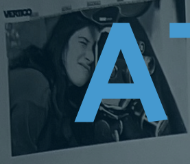
Chantal Akerman centraal op Cinematek-programma tijdens Bazar-tenoentstelling

Wie van de vrouwen achter onze grootste cineaste? Chantal Akerman was een van de meest invloedrijke vrouwen in de Belgische cinema. Haar werk wordt vaak gezien als een voorbeeld van vrouwelijke autonomie en artistieke vrijheid. In deze aflevering van de documentaire 'Chantal Akerman: De weg naar voren' wordt haar levenswerk getoond, van haar eerste films tot haar laatste meesterwerken. Het is een eerbetoon aan een vrouw die de grenzen van de cinema heeft uitgeweid en de wereld van de film heeft veranderd.